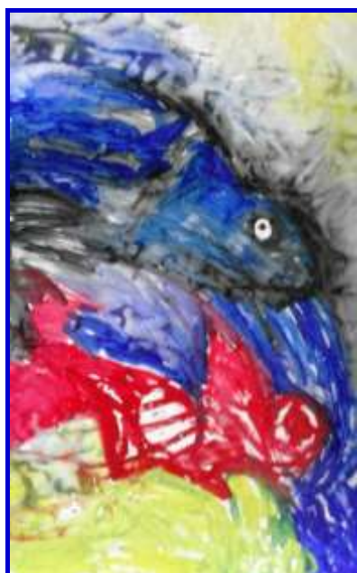
Kikko, senza titolo, n.d., acrilico su carta, 70 x 20 cm