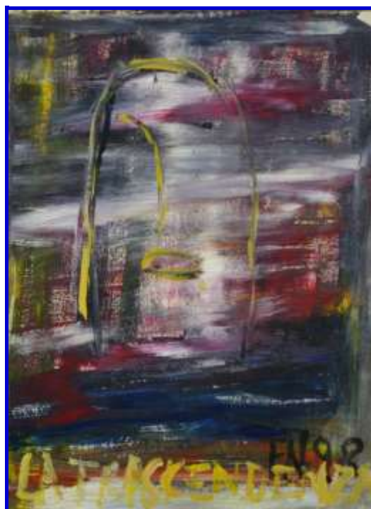
Fabio Negri, La trascendenza, 1998, acrilico su carta, 45 x 35 cm