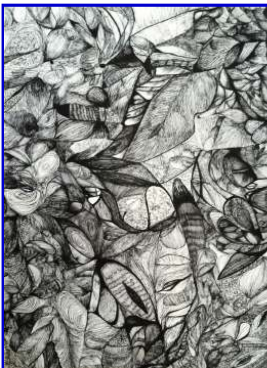
Kuffjca Cozma, si apa sa uscat in gura, 2016, penna su carta, 77 x 42 cm