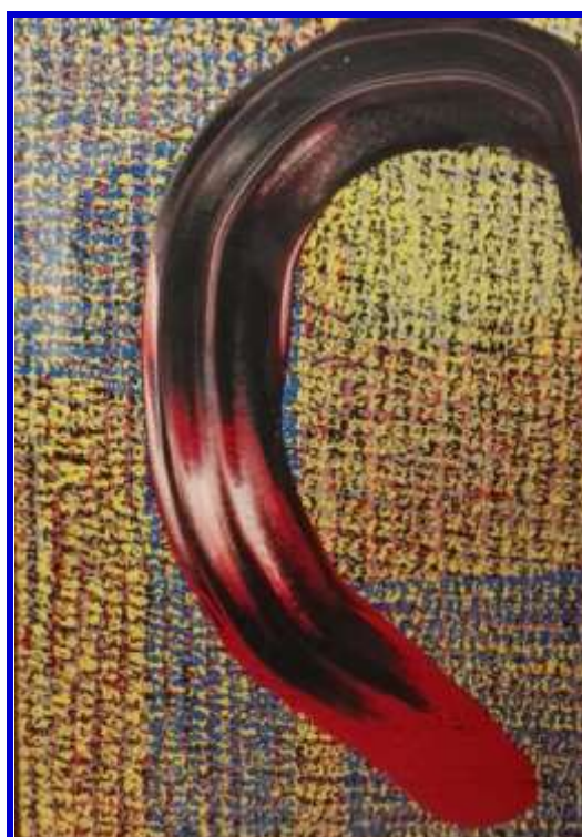
Francesco Maria Bibesco, Filters and jellies, 2016, tempera e acrilico su cartone, 72 x 101 cm