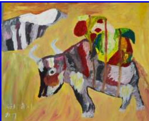
Umberto Gervasi, senza titolo,, 2011, acrilico su carta, 70 x 100 cm